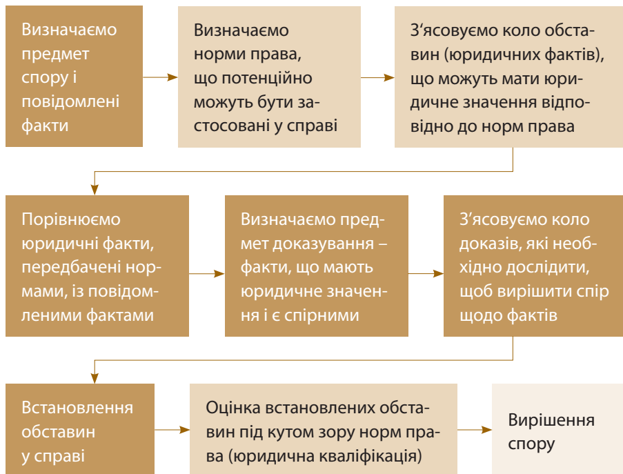
Схема 1. Алгоритм вирішення справи